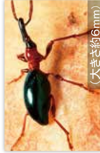
アリモドクソウムシ (大きさ約6mm)