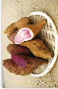
サツマイモ(紅イモなど) の生塊根