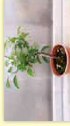
カンキツ類の苗木

詳しくは、事前に裏面★印の植物防疫所にお問い合わせください。なお、現在小笠原諸島には蒸熱処理施設がありません。