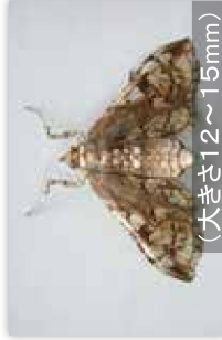
サツマイモノメイガ (大きさ12~15mm)