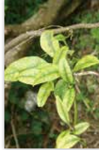
カンキツグリーニング病菌 (病気の症状)