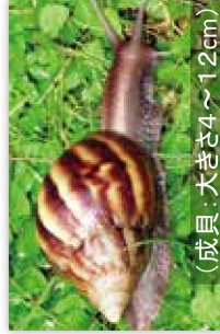
アフリカマイマイ (成貝、大きさ4~12cm)