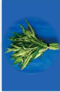
エンサイ(空心菜・ウチナーエハー) の生莖葉