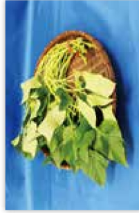
サツマイモ(紅イモなど) の生莖葉